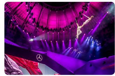
Mercedes auf der IAA