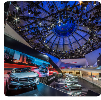
Mercedes auf der IAA