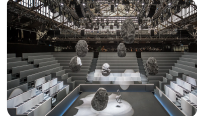
Das Mädchen mit den Schwefelhölzern © Ralph Larmann