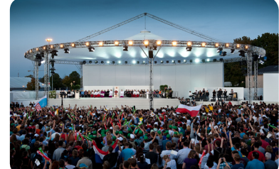
Magic Sky