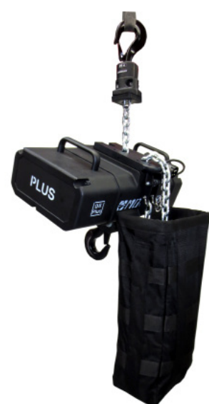
PLUS1000-4 und PLUSlite 1000-4 lieferbar

Das Team von Movecat ist stolz auf die Nominierung und freut sich über das Vertrauen der Anwender in die Produkte!